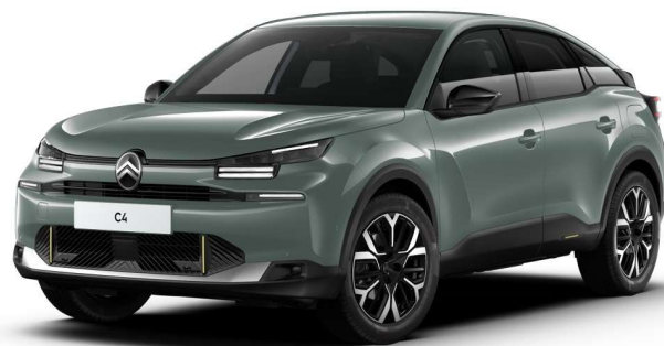
Verde Manhattan Opción