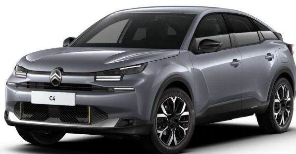
Mercury Grey Opción