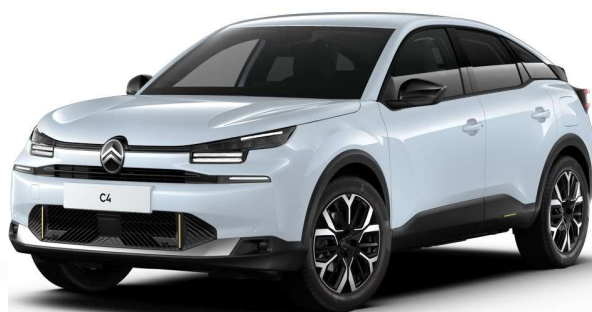
Blanco Okenite Opción