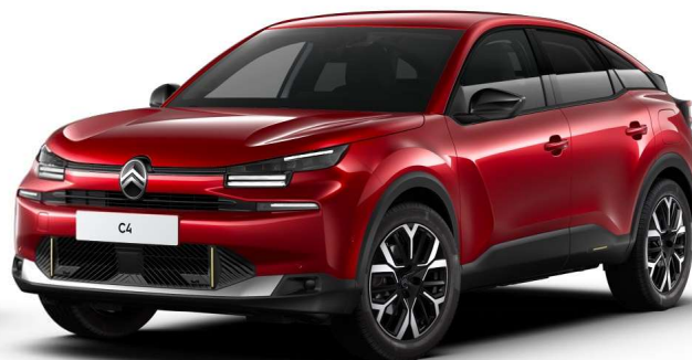
Rojo Elixir Opción No disponible en Nivel You