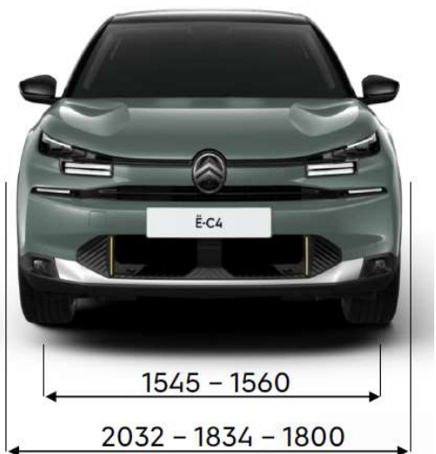
Ancho del vehículo con / sin retrovisores plegados