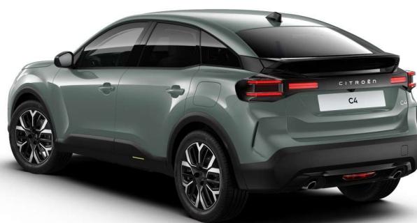
Volumen del maletero: 380 litros