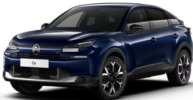
Azul Eclipse Opción