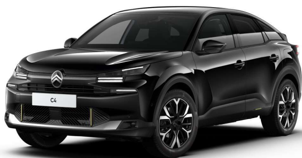
Negro Perla Nera Serie