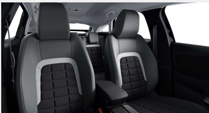
Ambiente Interior de Serie - Tela